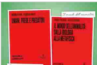
Graphe.it Edizioni investe sui Semi per il futuro