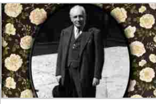
L'Archivio storico Tullio Serafin dichiarato "di interesse locale" dalla Regione del Veneto