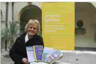
Premio Galileo 2019: Ecco la cinquina finalista